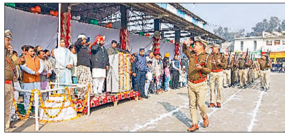
नारायणगढ़। परेड़ की सलामी लेते राज्यसभा सांसद कार्तिकेय शर्मा व अन्य।