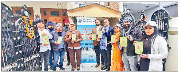
अंबाला। पीएनजी गैस कनेक्शन के लिए सेक्टर 9 के लोगों को जागरूक करते कंपनी अधिकारी।

पेट्रोलियम नेचुरल गैस रेगुलेटरी बोर्ड की ओर से गणतंत्र दिवस के मौके पर पूरे भारत में पाइप नेचुरल गैस अभियान की शुरुआत की गई। इसी कड़ी में हिंदुस्तान पेट्रोलियम ऑयल गैस कंपनी द्वारा सेक्टर-9 में दो घरों में पाइप नेचुरल गैस कनेक्शन लगाने का काम किया गया। इसके साथ-साथ प्रचार के माध्यम से पूरे सेक्टर में पाइप नेचुरल