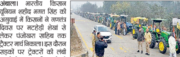
अंबाला। मटहंडी शेखां गांव के पास सड़क पर लाइन में खड़े ट्रैक्टरों का दृश्य।

अंबाला। भारतीय किसान यूनियन शहीद भगत सिंह की अगुवाई में किसानों ने गणतंत्र दिवस पर मटहंडी शेखां से लेकर पंजोखरा साहिब तक ट्रैक्टर मार्च निकाला। इस दौरान सड़कों पर ट्रैक्टरों की लंबी लाइनें देखकर पुलिस को भी परेशानी आ गयी। आनन फानन में ट्रैक्टर मार्च को लेकर पुलिस की ओर से सुरक्षा के लिए जल्द्री बंदोबस्त किए गए। मटहंडी शेखां से शुरू हुआ ट्रैक्टर मार्च पंजोखरा साहिब पहुंचा। यहां किसानों ने पंजोखरा साहिब गुरुद्वारा में मत्था टेककर अपने लिए दिल्ली कूच की उरअदास की। किसानों ने 13 फरवरी को दिल्ली कूच का ऐलान किया। भारतीय किसान यूनियन शहीद भगत सिंह के आह्वान पर सुबह से ही किसान मटहंडी शेखां में एकजुट हुए थे। यहां से ट्रैक्टर मार्च निकलते हुए लखनौर साहिब के लिए रवाना हुए। किसानों ने ट्रैक्टर लेटर मार्च में शामिल हुए। लखनौर साहिब से आगे निकलते हुए शाहपुर-मटहंडी पहुंचे। शहीद भगत सिंह किसान यूनियन के अध्यक्ष ने कहा कि दिल्ली कूच के दौरान सरकार के सामने फसलों पर एमएसपी गारंटी कानून बनाने, किसानों को कर्जा मुक्ति करने, लखनौर खेरी के किसानों को इन्साफ, अतिरिक्त की जाने वाली जमीनों को 4 गुना रेट देना व बिजली बिलों को रद्द करने मांग रखी जाएगी। उन्होंने कहा कि किसान आंदोलन के दौरान केंद्र सरकार ने फसलों पर एमएसपी गारंटी कानून बनाने की बात कही थी। मगर अब तक सरकार ने अपने उस वादे को पूरा नहीं किया है। किसानों ने ऐलान किया कि अगर सरकार ने उनकी मांगों पर विचार नहीं किया तो फिर दूसरा किसान आंदोलन होगा। सभी किसान दिल्ली में ही डेरा डाल लेंगे।