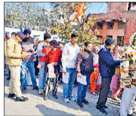
अंबाला। गृहमंत्री के आवास पर लगी लोगों की लाइनें।

दुराचार पीड़िता की शिकायत पर संज्ञान लेते हुए गृहमंत्री अनिल विज ने गोहाना डीएसपी को फटकार लगाई है। दुराचार के अन्य मामले में भिवानी के एसपी को भी मामले में सख्त कार्रवाई के निर्देश दिए गए हैं। विज शनिवार को अपने आवास पर लोगों की फरियादें सुन रहे थे। गोहाना से आई दुराचार पीड़िता ने बताया कि मामले में पुलिस ने अभी